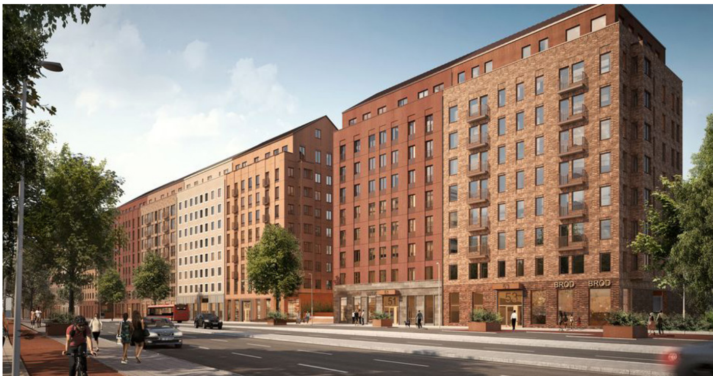
Vy längs Solnavägen från norr. Illustration BAU