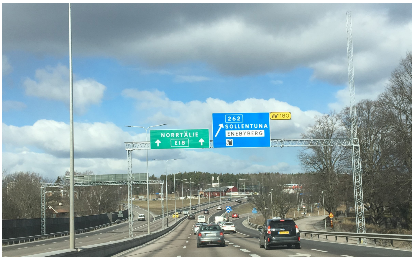
E18 Stocksund Arninge.