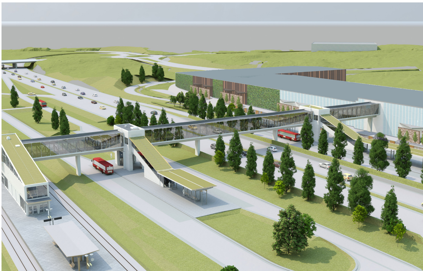
Visionsbild Arninge station. Illustration Ahlqvist och Almqvist arkitekter