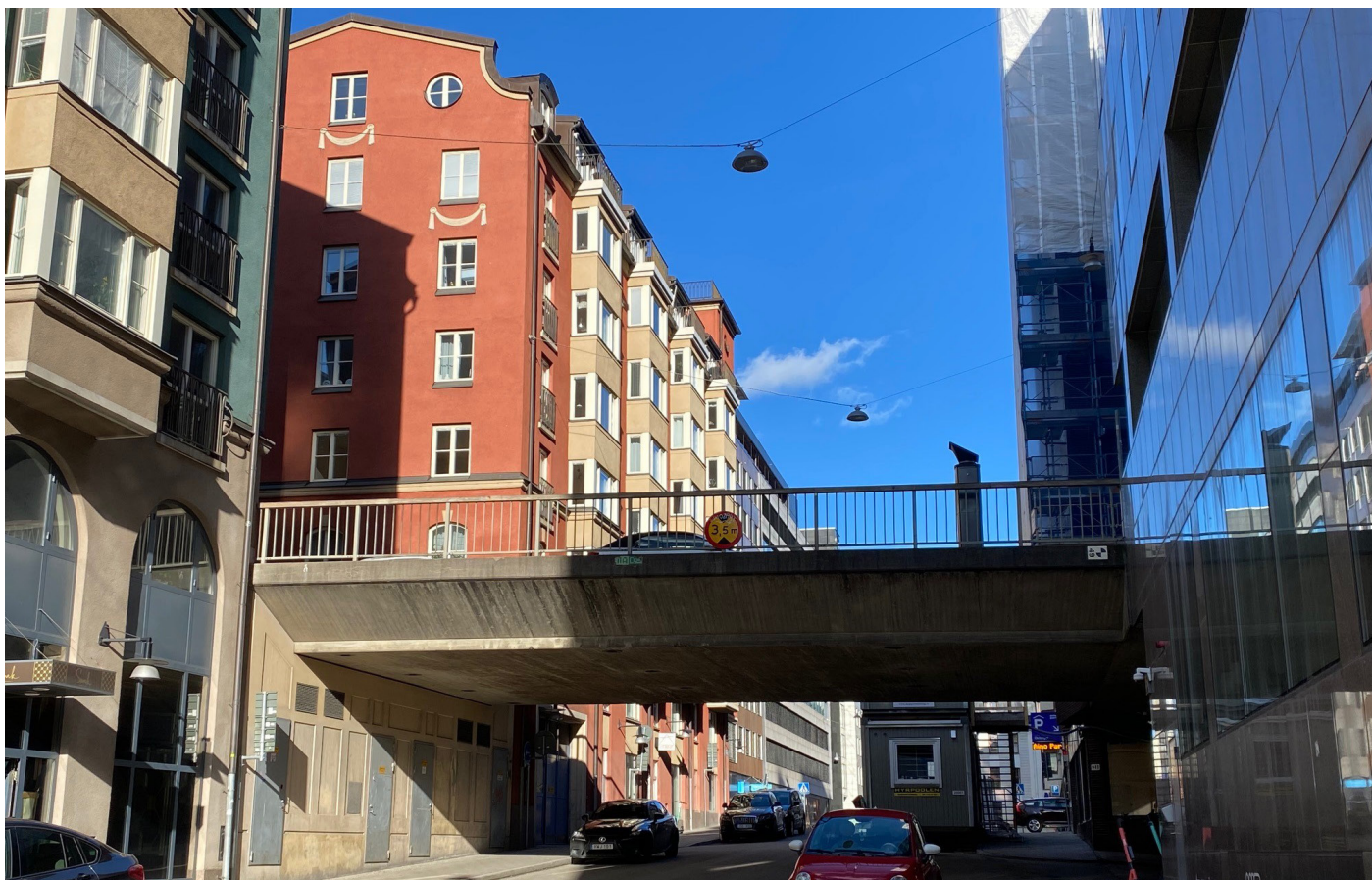
Bron över Oxtorgsgatan.

vaxer.stockholm/malmskillnadsgatansbro_oxtorget