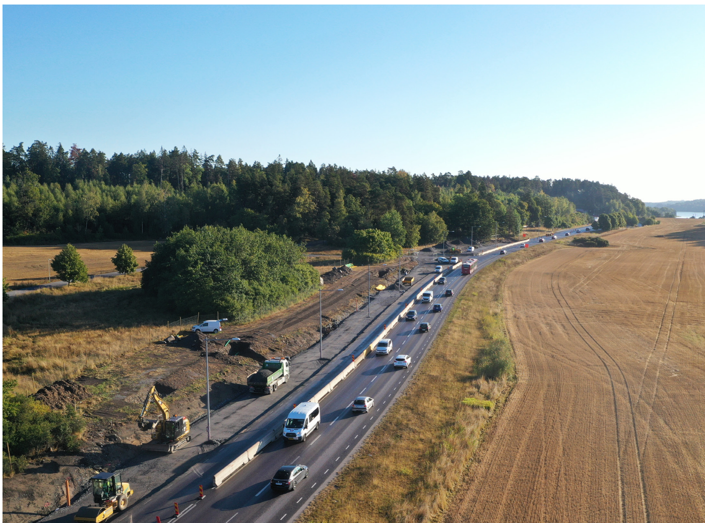
Förbifart Stockholm Ekerövägen.

trafikverket.se/forbifartstockholm-ekero