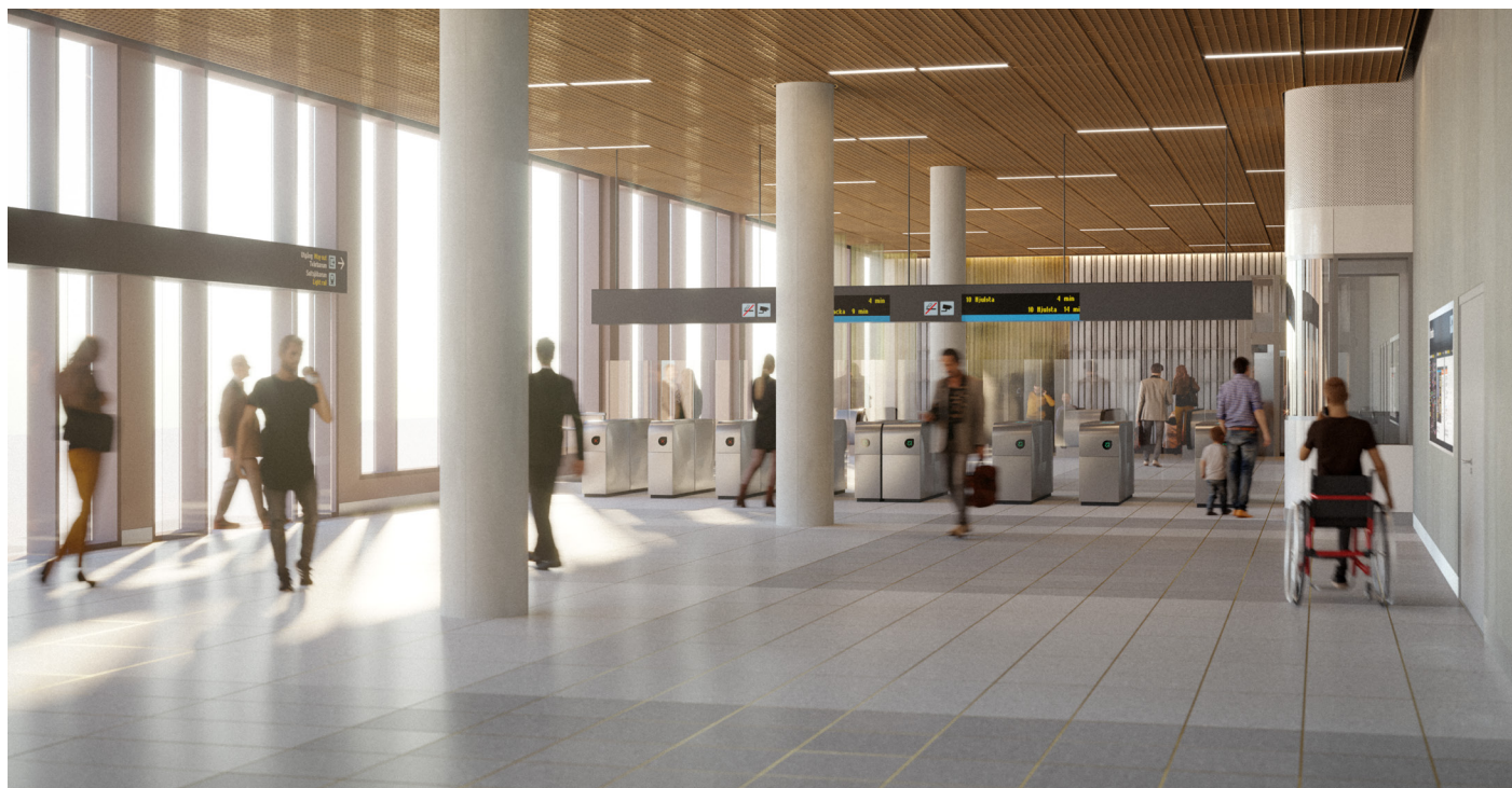
Visionsbild över Sickla biljetthall.

https://nyatunnelbanan.se/sv/arbeten-i-sickla