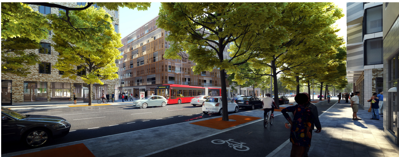
Visionsbild del av Värmdövägen och Vikdalsvägen