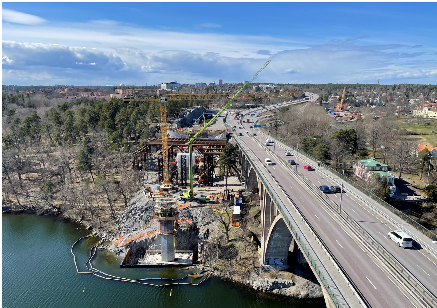
Väg 222 Skurubron sett från trafikplats Björknäs.