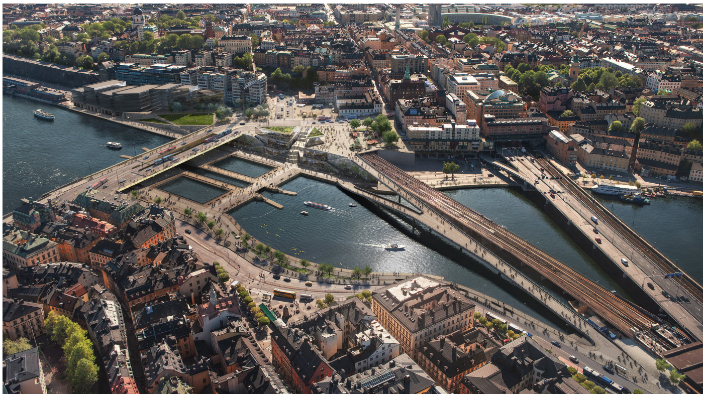
Slussen överblick.