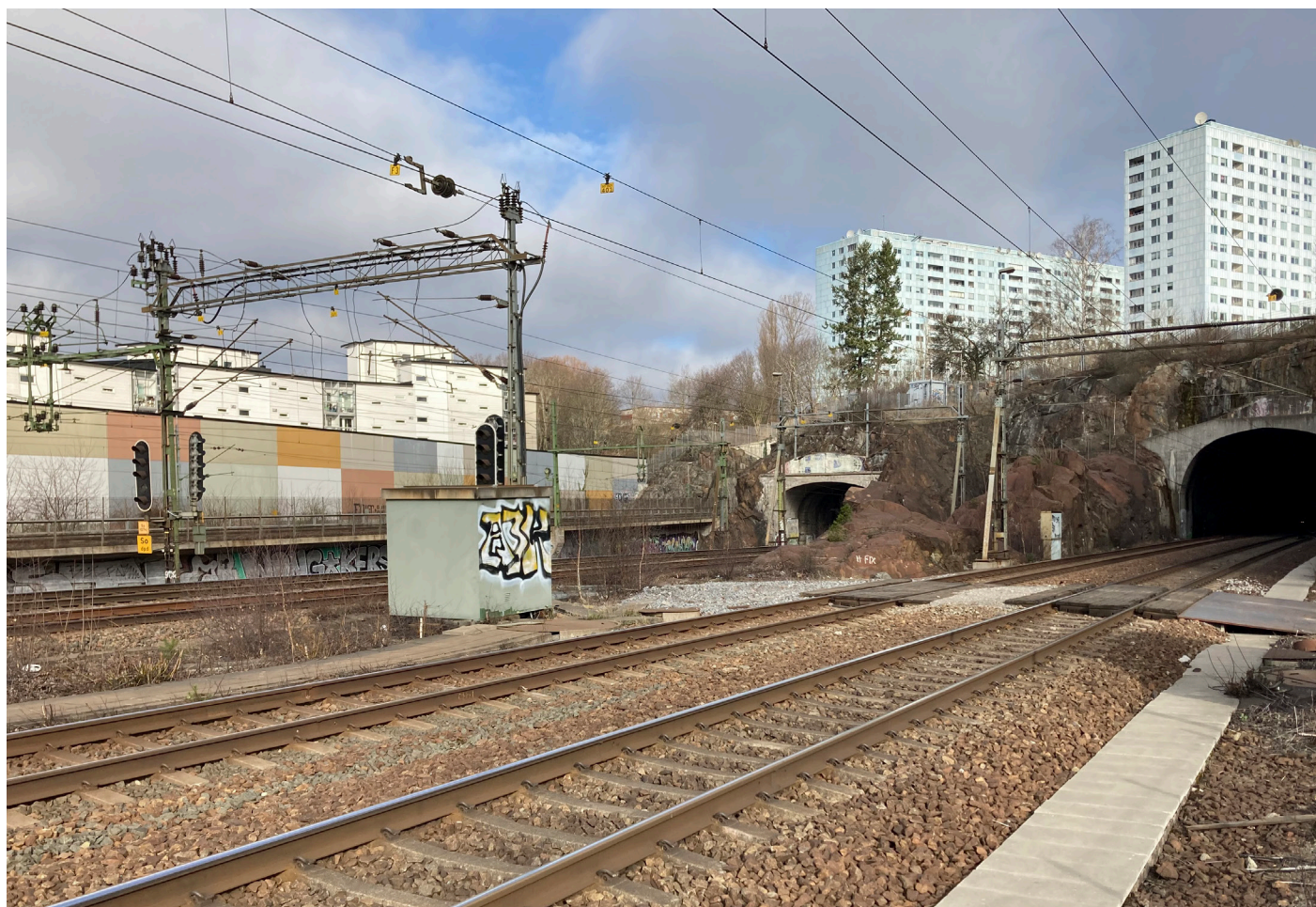
Solnatunnelarna söderifrån.