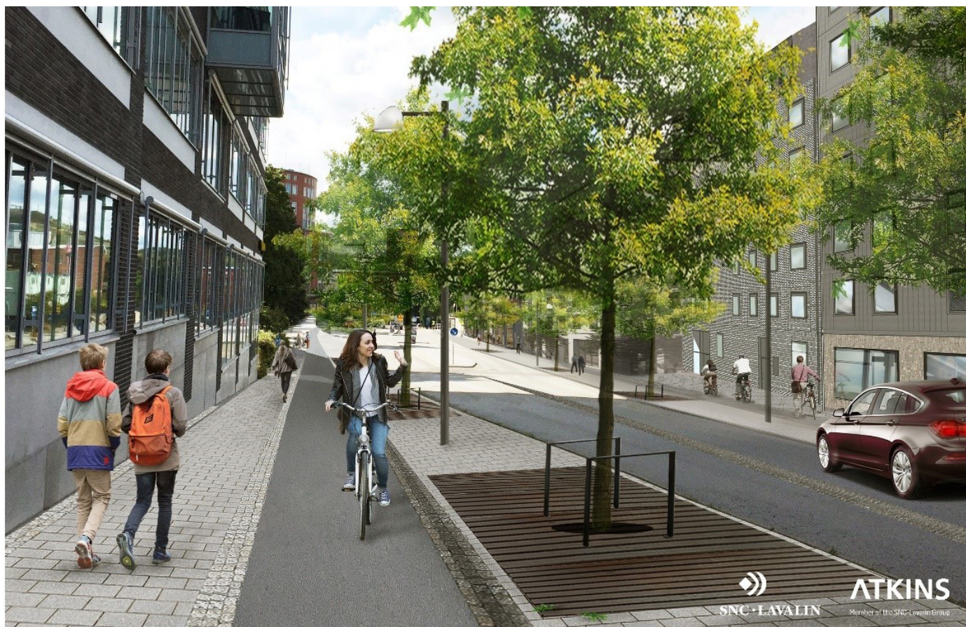
Visionsbild del av Värmdövägen och Vikdalsvägen