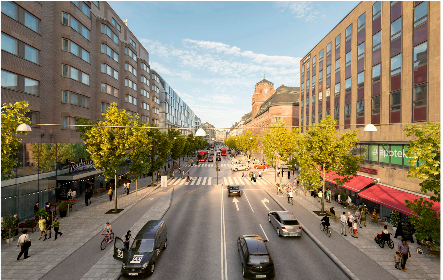
Visionsbild Vasagatan.